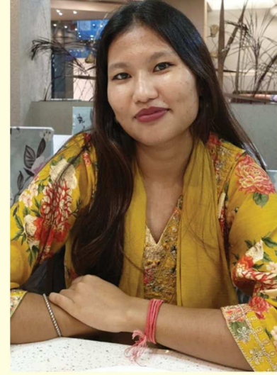
সোণালী স্বৰ্গীয়াৰী প্ৰাগজ্যোতিষ মহাবিদ্যালয়