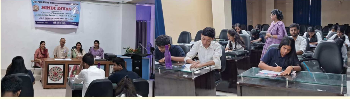
হিন্দী দিবস উদযাপন