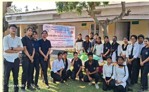
অসম শিশু কল্যাণ সদন পৰিদৰ্শনৰ মুহূৰ্ত

ছমহীয়া ডিজিটেল আলোচনী প্রথম প্রকাশ, ডিচেম্বৰ, ২০২৫