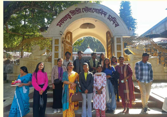
ক্ষেত্র অধ্যয়নৰ কেইখনমান আলোকচিত্র

ছমহীয়া ডিজিটেল আলোচনী প্রথম প্রকাশ, ডিচেম্বৰ, ২০২৫