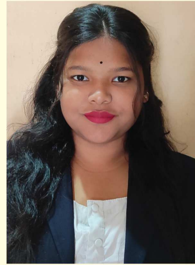
প্ৰীতি দাস পাণ্ডু মহাবিদ্যালয়

ছমহীয়া ডিজিটেল আলোচনী প্ৰথম প্ৰকাশ, ডিচেম্বৰ, ২০২৫