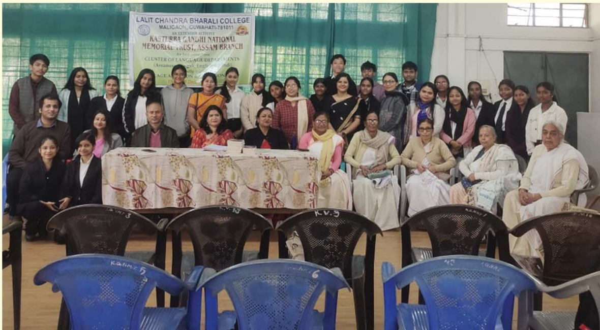
কস্তুরবা গান্ধী আশ্রমৰ কেইখনমান আলোকচিত্ৰ