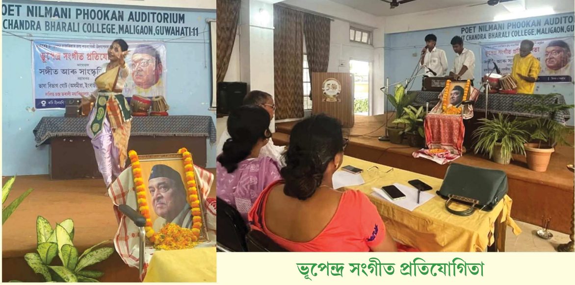
ভূপেন্দ্র সংগীত প্রতিযোগিতা