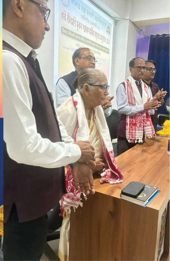
কবি নীলমণি ফুকন স্মাৰক বক্তৃতা অনুষ্ঠান

ছমহীয়া ডিজিটেল আলোচনী প্ৰথম প্ৰকাশ, ডিচেম্বৰ, ২০২৫