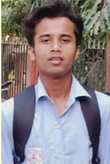
পংকজ দাস প্ৰাগজ্যোতিষ মহাবিদ্যালয়